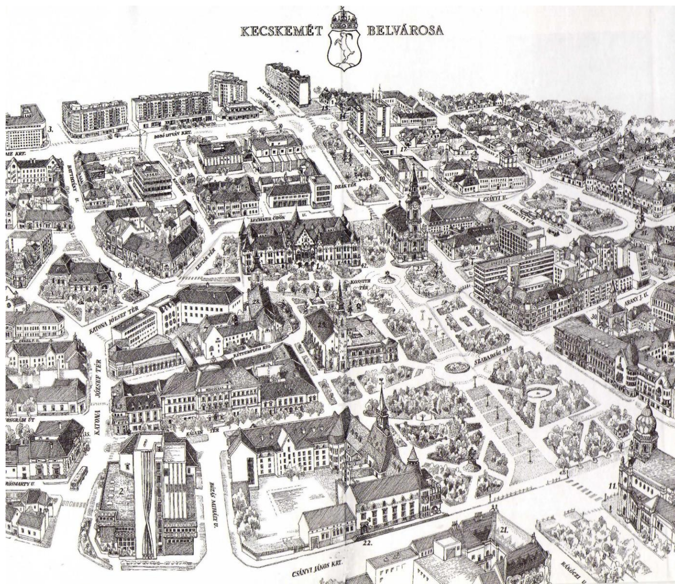
Kecskemét központját láthatjátok az 1990-es évekből.