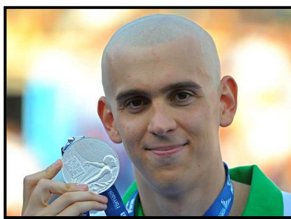
Cseh László úszás