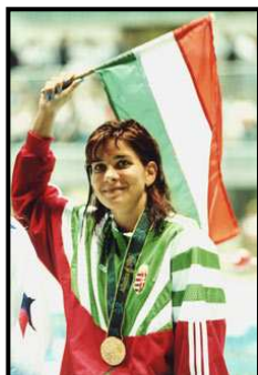
Egerszegi Krisztina úszás